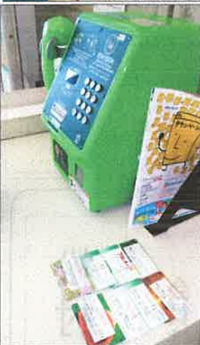
善意のテレホンカード