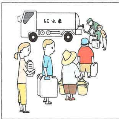
神戸市水道局 「災害時の応急給水」 https://kobe-wb.jp/oukyuukyuu

が起ったとき、この際自宅近くの「災害時給水ポイント」を調べてみていかがでしょうか？ (昭)